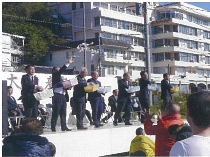
オープニング餅まき風景