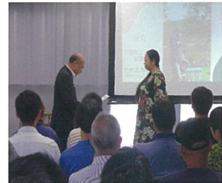
参加者54名 表彰式風景