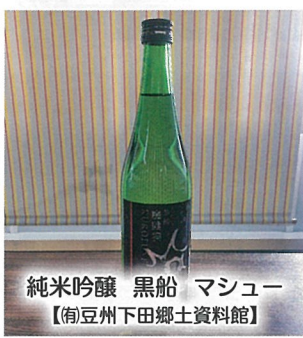
純米吟醸 黒船 マッシュー 【南豆州下田郷土資料館】