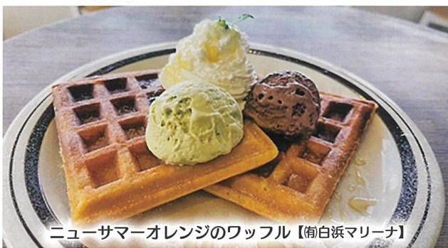
ニューサマーオレンジのワッフル【南白浜マリーナ】