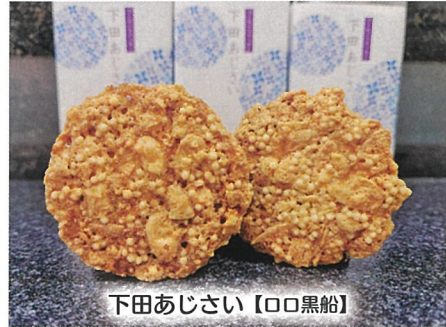
下田あじさい【口黒船】