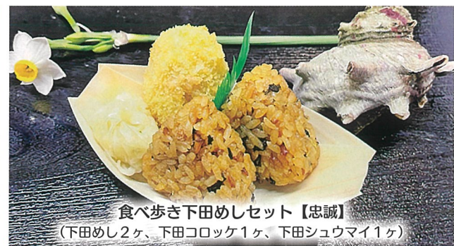
食べ歩き下田めしセット【忠誠】 (下田めし2ヶ、下田コロッケ1ヶ、下田シュウマイ1ヶ)