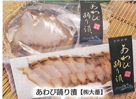
あわび踊り漬【榊大番】