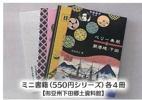
ミニ書籍 (550円シリーズ) 各4冊 【南豆州下田郷土資料館】