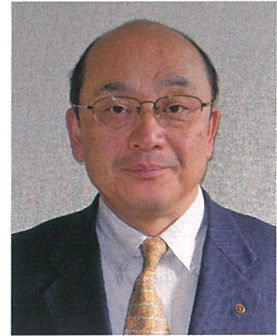
下田商工会議所 会頭