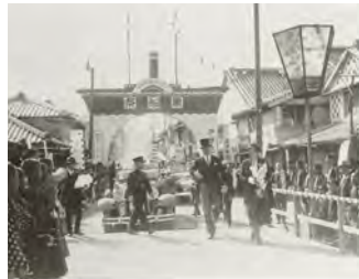
第 1 回黒船祭歓迎アーチとグルー大使夫妻