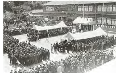
黒船祭式典会場（旧下田小学校々庭にて）